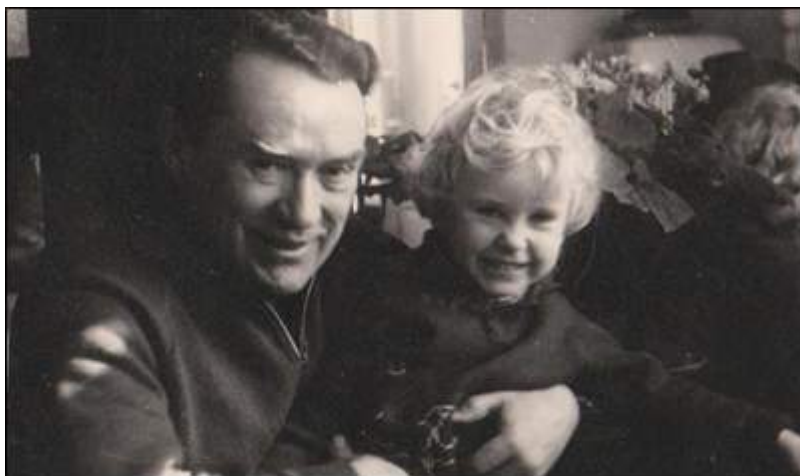
(Мой прадедушка с моей мамой)