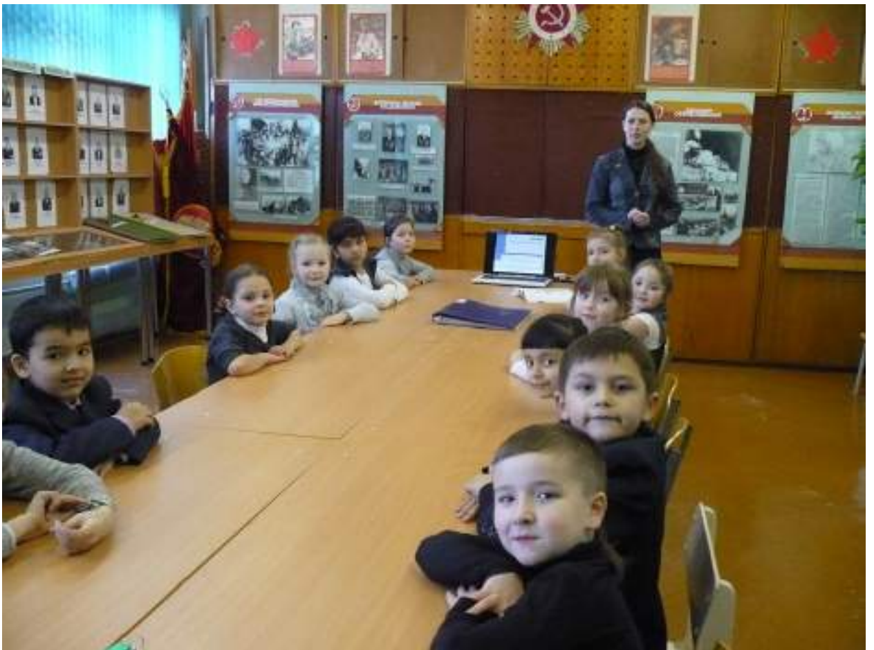
(1 «б» в музее на занятии, посвященном Великой Отечественной войне).