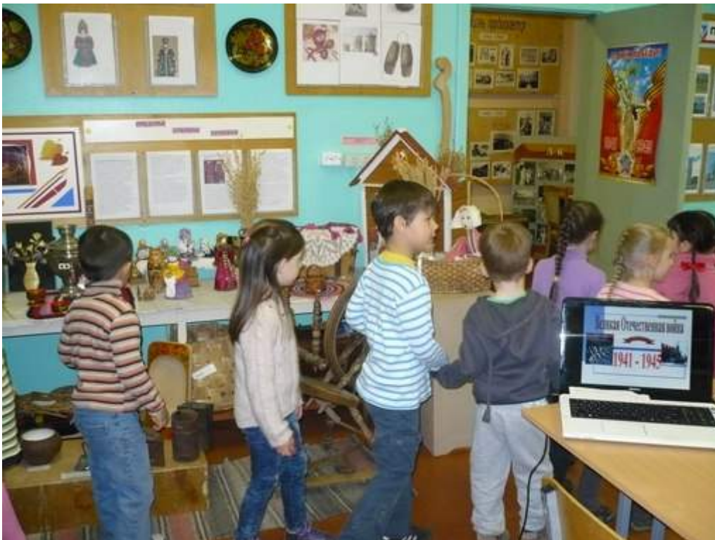
(Самые маленькие посетители школьного музея. Дошкольники подготовительной группы на экскурсии)