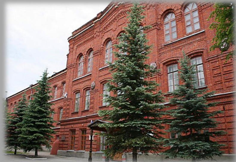
Суворовское училище в Ульяновске