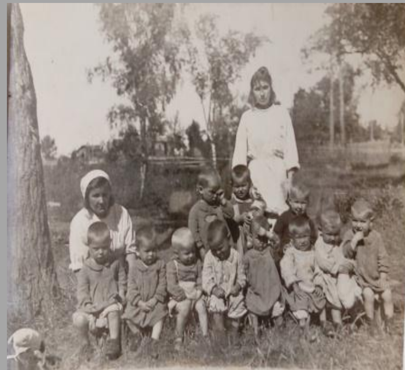
1947 год - очень голодный. Жена работала в яслях.