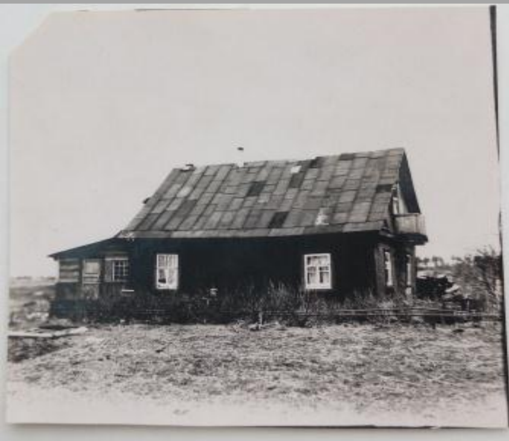
Дом в Средней Колонии