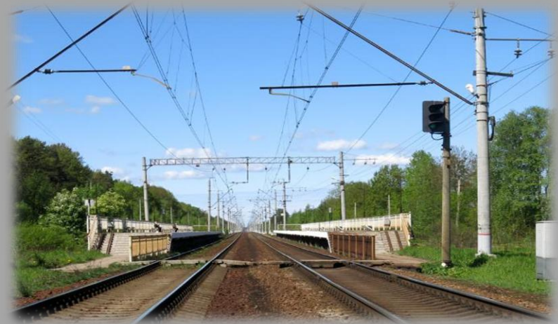
Платформа «Заводская», сейчас «Красные Зори»