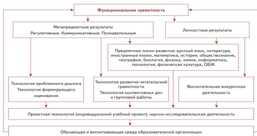
Схема «Система работы школы по обеспечению личностных и метапредметных (УУД) результатов школьников»

Из схемы видно, что существует несколько механизмов развития личностных и метапредметных результатов: